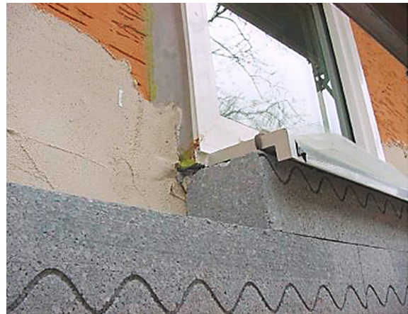
Ein kompletter Fenstertausch bietet sich an, wenn gleichzeitig die Außenwand mit einer Außendämmung versehen werden soll. Dann ist ein Austausch besonders günstig durchzuführen.

Sind die Fensterrahmen gut erhalten und wärmegeklämt, reicht es oft schon, nur die Verglasung zu verbessern. Tauschen Sie das Glas gegen Wärmeschutzglas!