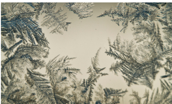
Einfach verglaste Fenster erkennt man im Winter an der Bildung von Eisblumen.

Vielfach findet man in Wohnhäusern noch Fenster und Außentüren mit einfacher Isolierverglasung oder gar Einfachverglasung. Manchmal sind auch die Rahmenfugen undicht. Oder die Wärmedämmeigenschaften der verwendeten Glas- und Rahmenmaterialien sind nur gering. Bei niedrigen Außentemperaturen kühlen die Scheiben dann bis auf Minusgrade herunter und entziehen dem Wohnraum Wärme. Selbst wenn alle Fugen abgedichtet sind, kommt es so zu hohen Energieverlusten, unangenehmen Zugscheinungen und einem insgesamt unbehaglichen Wohnklima. Die dafür verantwortlichen Fenster sollten deshalb unbedingt schnell ersetzt werden.