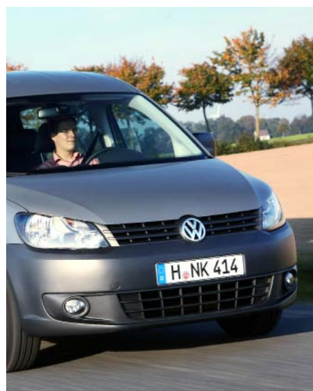
Erdgasfahrzeuge - besonders umweltfreundlich mit Bioerdgas.

Die Kraftstoffpreise erreichen einmal mehr neue Höchststände. Neben dem Anstieg der Rohölpreise sorgt die Einführung des umstrittenen