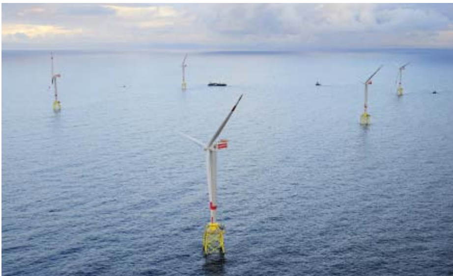
Windenergie muss künftig besser in das Stromversorgungssystem integriert werden.