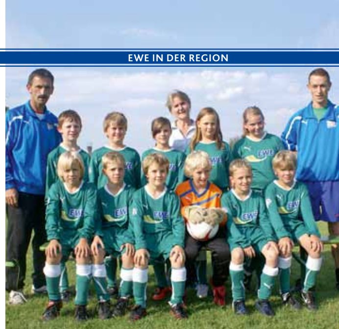
Dieses Jahr auch zum 1. Mal dabei: RSV Mellensee.